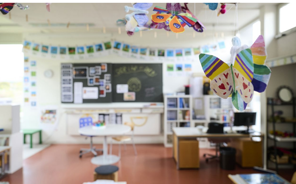
Ab den Sommerferien gilt an den Schulen der Stadt der Zweijahresturnus.

Ein Thema, das die Stadt seit Jahren beschäftigt, ist auch 2026 im Fokus: Das Ressort Gesellschaft prüft, inwiefern ein neues Freibad als Ersatz für das Bad im Lido realisiert werden